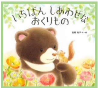
いちばんしあわせなおくりもの (古里所蔵 110692977)

大好きなくまくんに贈り物をしたい。こりすが何が欲しいかたずねると「なにもいらない」「きみとここにいるだけでぼくはともしあわせなんだ」お互いを想う愛にあふれた作品。