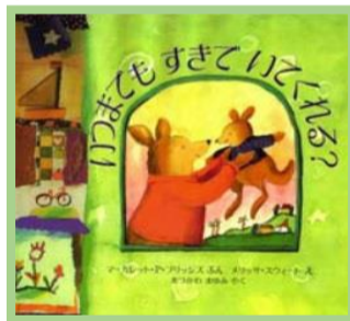
いつまでもすきていてくれる?

ぼくがおとなになったら…りんごの木になったら…せっけんになっちゃったら…それでも、ぼくのこと、かわいいとおもう? やさしいママのあたたかく心にしみる愛のお話。