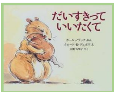
だいすきっていいたくて (氷川所蔵 210758363)

素敵な言葉をママに言おうとしました。でも、ママはパタパタ大忙し。「あとでね」口からはすてきな言葉をあげる人を探しますが…やさしい気持ちを贈る絵本。